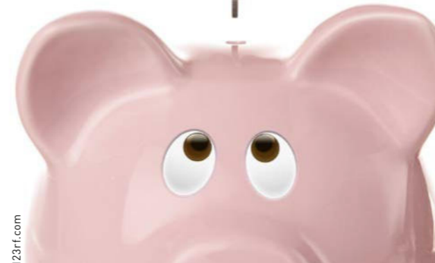
Dank dem Sonderbeitrag erhalten der SBK und seine Sektionen mehr Ressourcen für die Umsetzung der Pflegeinitiative.

Voir aussi sur www.sbk-asi.ch . Des informations détaillées paraîtront dans Soins infirmiers 1/2023.