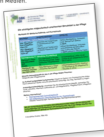
Nach langjähriger Ausbildung, hat man Anrecht auf eine korrekte Berufsbezeichnung in den Medien.